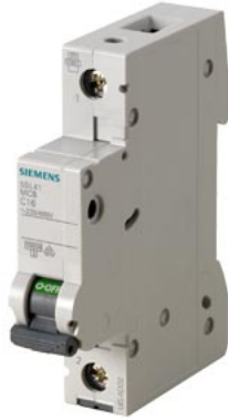
Automático magnetotérmico 240/415V 10kA, 1 polo, C, 4A